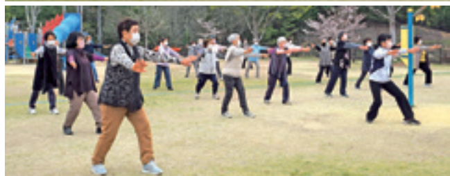
▲入学式後に桜が舞う中で太極拳を行ないました。(健康大学追分支部)