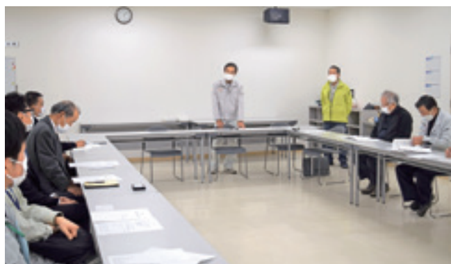
▲活発な意見が飛び交いました。

2023年度は、講習会などで会員の栽培技術向上に力を入れ、消費者に求められる高品質な商品の出荷をめざします。総会後は月例会を行ない、活発な意見が飛び交いました。