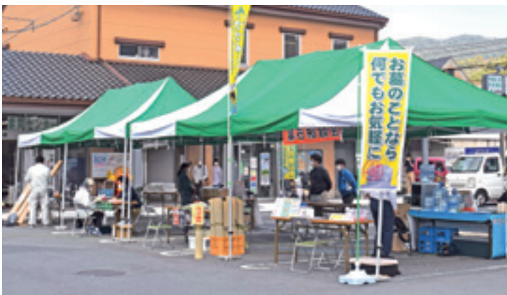
▲生活に関する各種相談コーナーを設けました。(瀬野アグリセンター)